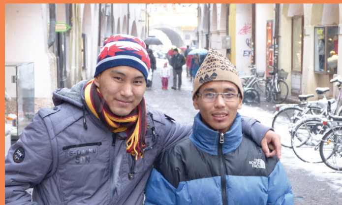
Ausbildung in Südtirol/formazione professionale in Alto Adige Trinkwasserprojekte/progetti acqua potabile

Dopo il primo soccorso, aiuteremo principalmente nella ricostruzione delle infrastrutture. Porteremo avanti vari microprogetti di sostegno per orfanotrofi, scuole, approvvigionamento di acqua potabile e energia elettrica, iniziative per donne e madri, ecc.